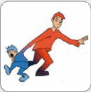
Résiste aux changements