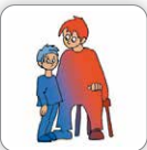
Évite le regard