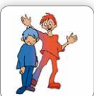
Indifférent aux autres