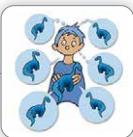
Parle sans cesse du même sujet