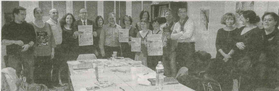
Autisme Pau Béarn Pyrénées : un challenge toujours renouvelé !

Samedi, c'est une journée rencontre d'information et de partage qui est proposée au Phare.