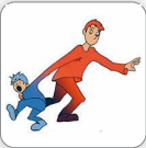
Résiste aux changements