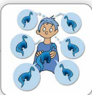
Parle sans cesse du même sujet