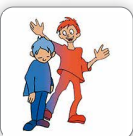
Indifférent aux autres