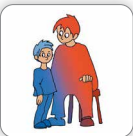
Évite le regard